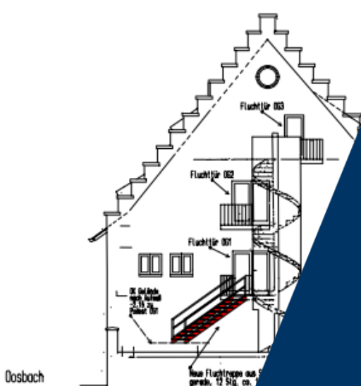
Ansicht Süd St. Josef-1