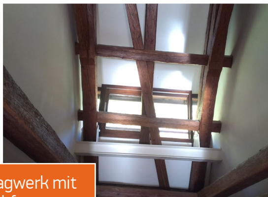
Dachtragwerk mit Stahlabfangung