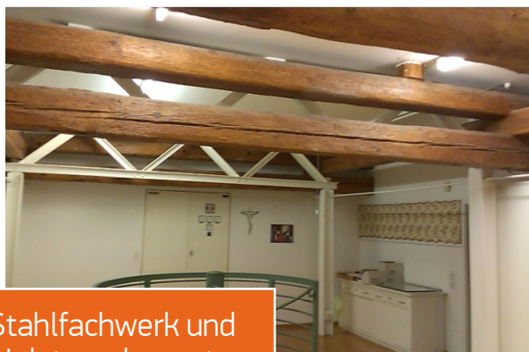
Stahlfachwerk und Holztragelemente